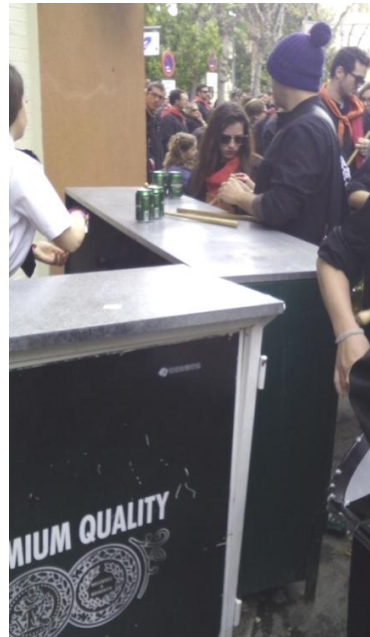
Plaza de Santa Ana

Es de lamentar la presencia de barras en la vía pública que no son retiradas al paso de la procesión y que provocan tapones en los lugares donde están ubicadas, tales como: