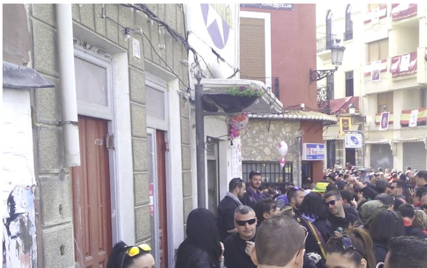
Calle El Rabal