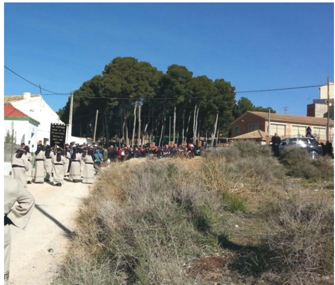
Salida del Camino de las Columnas a Carretera de Liétor

Se estudiará un cambio en el recorrido para evitar la estrechez de la entrada a la calle Camino Las Columnas accediendo por la calle La Monecilla desde la Avenida de la Constitución.