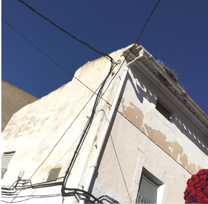
C/ Rosalía de Castro/ C/ Andalucía